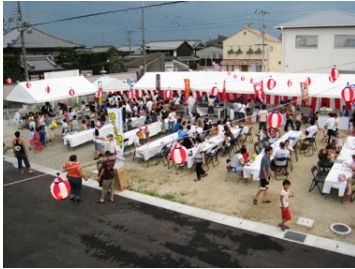
町おこしイベント