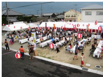
町おこしイベント